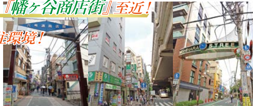
幡ヶ谷六号通り商店街 幡ヶ谷商店街 西原商店街