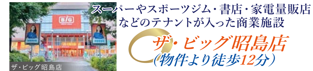
ザ・ビッグ昭島店