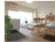
〈バーチャルホームステージング〉 ※画像はイメージです。 実際の家具配置とは異なる場合がございます。