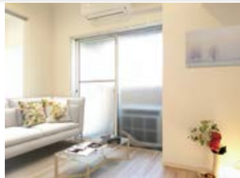
〈バーチャルホームステージング〉 ※画像はイメージです。 実際の家具配置とは異なる場合がございます。