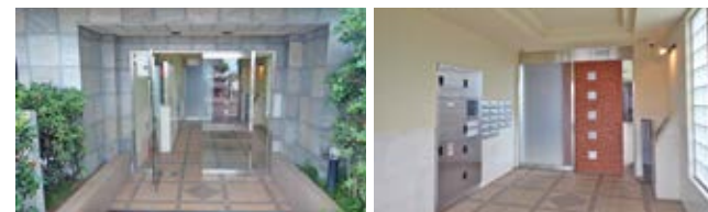
エントランス エントランスホール