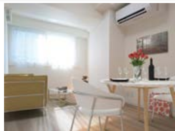
〈バーチャルホームステージング〉 ※画像はイメージです。 実際の家具配置とは異なる場合がございます。