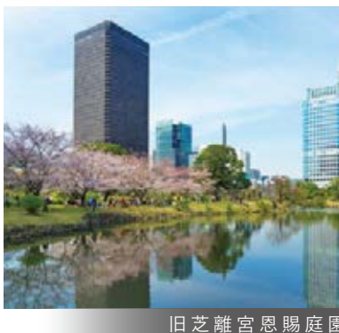
旧芝離宮恩賜庭園