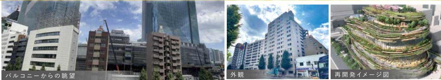
パルコニーからの眺望