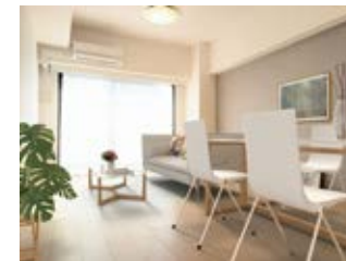
〈バーチャルホームステージング〉 ※画像はイメージです。実際の家具配置とは異なる場合がございます。