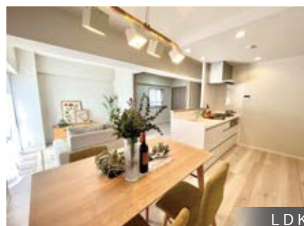
※内装写真はイメージです。実際とは異なる場合がございます。