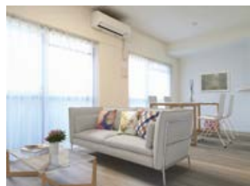
〈バーチャルホームステージング〉 ※画像はイメージです。 実際の家具配置とは異なる場合がございます。