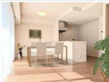
〈バーチャルホームステージング〉 ※画像はイメージです。 実際の家具配置とは異なる場合がございます。