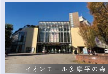
イオンモール多摩平の森

スーパーや飲食店など 約120件のテナントが入った 商業施設 【イオンモール多摩平の森】 まで徒歩14分!