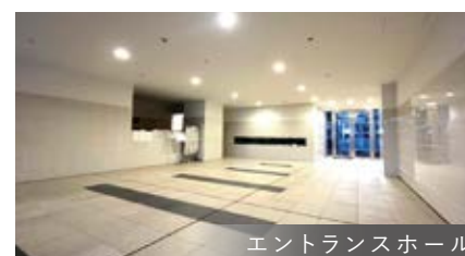
エントランスホール