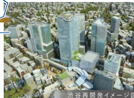
渋谷再開発イメージ図

平成17年 給水システム改修工事 平成23年 大規模修繕工事 令和4年 1階通用口リニューアル工事 (オートロック設置)