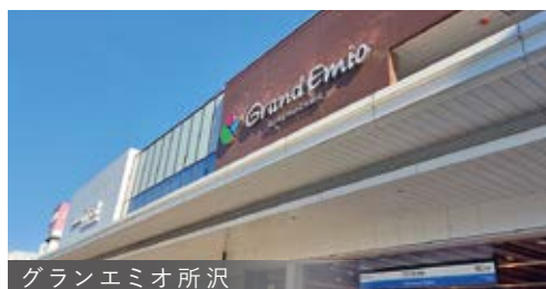
グランエミオ所沢

2024年9月開業の商業施設 『エミテラス所沢』 全142店舗に加え屋上庭園 『そらくもひろば』 Tジョイエミテラス(映画館)有