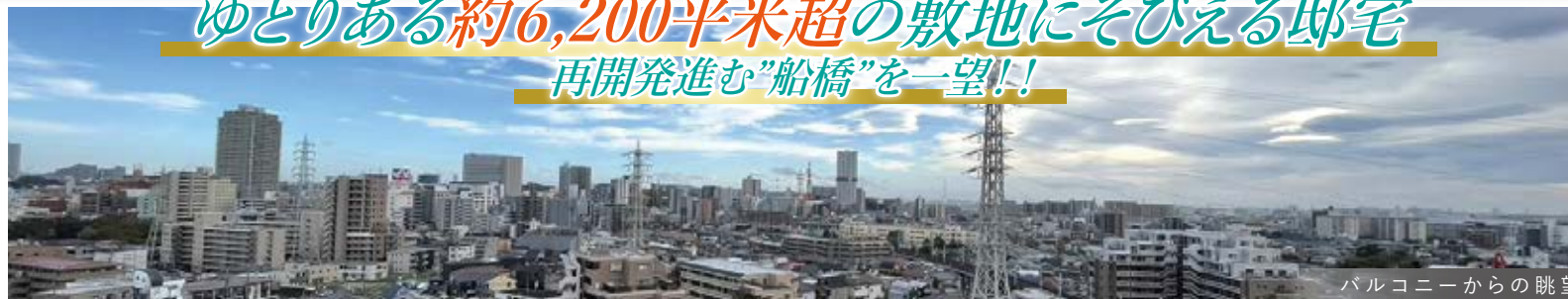
バルコニーからの眺望