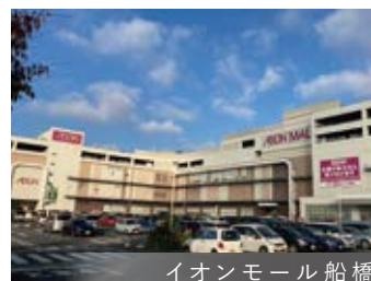
イオンモール船橋