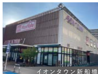
イオンタウン新船橋