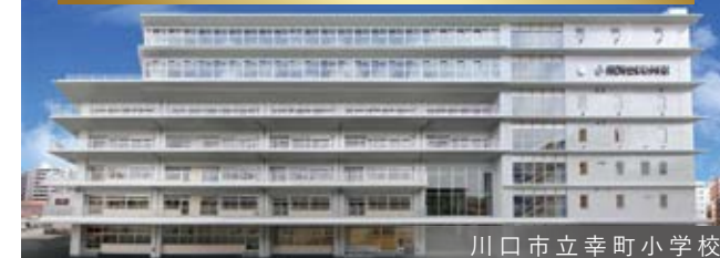
川口市立幸町小学校