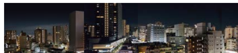
バルコニーからの眺望(夜)