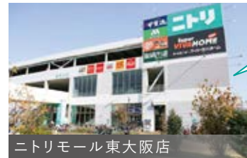
ニトリモール東大阪店

スーパー、フードコート、衣料品店などが併設された複合商業施設『ニトリモール東大阪店』が徒歩11分!