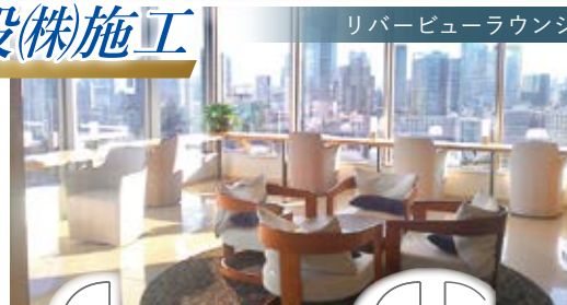
リバービューラウンジ