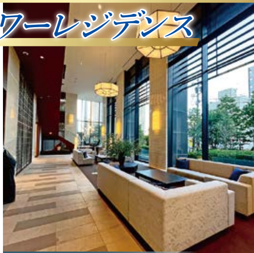
エグゼクティブラウンジ