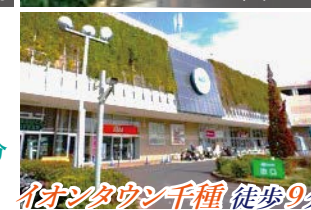
イオンタウン千種 徒歩9分