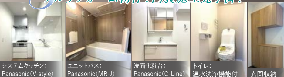
システムキッチン: Panasonic(V-style)