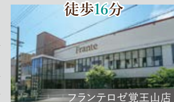
フランテロゼ覚王山店