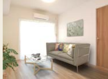
〈バーチャルホームステージング〉 ※画像はイメージです。 実際の家具配置とは異なる場合がございます。