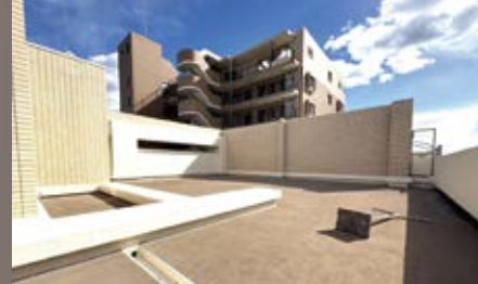
約44.45坪の広タルーフバルコニー