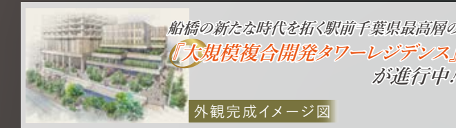
外観完成イメージ図