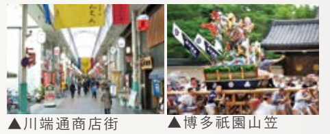
▲川端通商店街 ▲博多祇園山笠

魅力あふれる 「中洲川端」駅周辺! 130年以上の歴史がある『川端通商店街』は全長400m、老舗はもちろん新しい店まで130軒を超える様々な店舗があり活気にあふれています! 博多を代表するお祭り『博多祇園山笠』や『博多どんたく』の開催エリアにもなっているので、お祭り季節は街中が大変賑わいます!