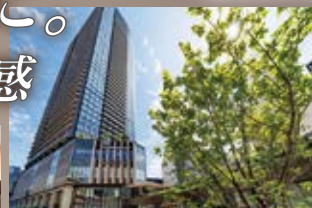
THE YOKOHAMA FRONT

横浜、関内、桜木町まで電車で15分圏内!! お買い物に休日のレジャーも楽しめます!