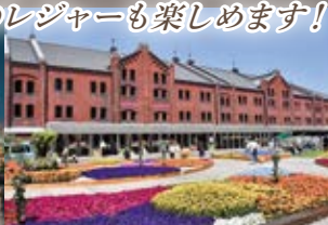
横浜赤レンガ倉庫