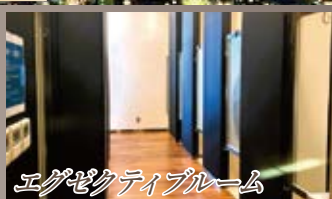
エグゼクティブルーム