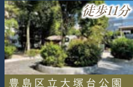
豊島区立大塚台公園