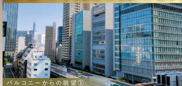
バルコニーからの眺望①