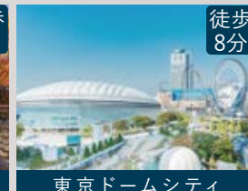
東京ドームシティ 徒歩8分