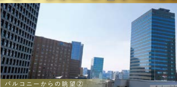
バルコニーからの眺望②