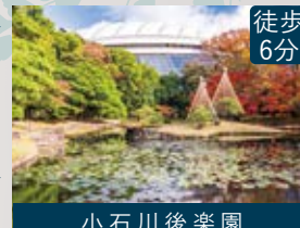
小石川後樂園 徒歩6分