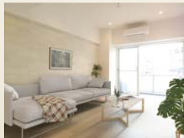
〈バーチャルホームステージング〉 ※画像はイメージです。 実際の家具配置とは異なる場合がございます。

「白山」駅徒歩1分。夕景を望む窓辺、一日の終わりを贅沢に。 歴史と文化の調和が彩る【文京区白山】に住まう