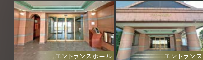
エントランスホール エントランス