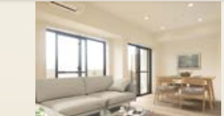
〈バーチャルホームステージング〉 ※画像はイメージです。 実際の家具配置とは異なる場合がございます。