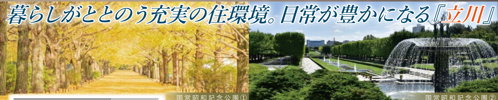
国営昭和記念公園① 国営昭和記念公園②