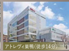
アトレヴィ巣鴨(徒歩14分)