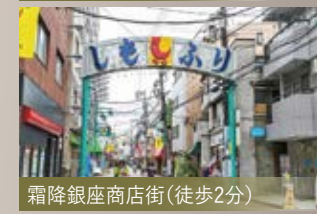
霜降銀座商店街(徒歩2分)