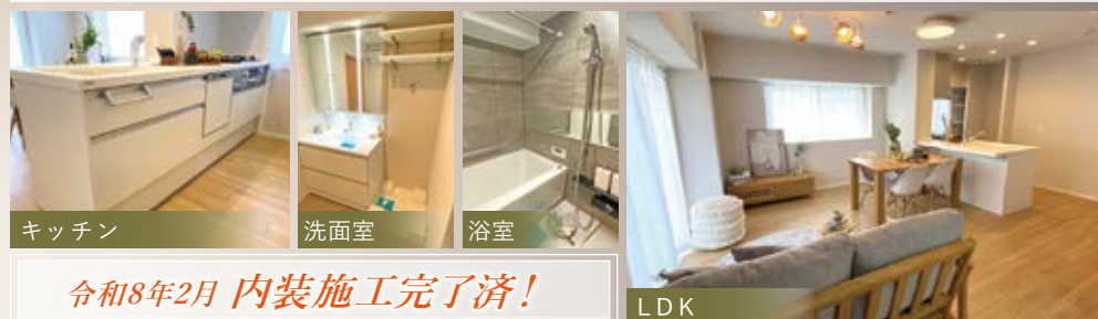
キッチン 洗面室 浴室 LDK

1フロア2住戸!内廊下でプライバシーに配慮されています 玄関には戸建て感のある 玄関ポーチ付!