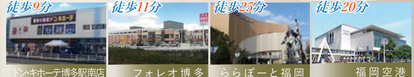
ドンキホーテ博多駅南店