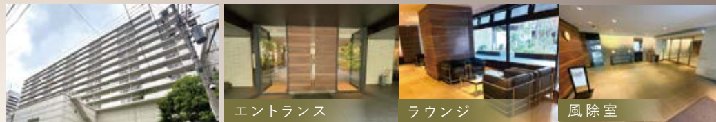
偶田川 外観 エントランス ラウンジ 風除室

【他都心へのダイレクトアクセス可!】 有楽町線▶ 「銀座一丁目」駅3分 「池袋」駅24分 大江戸線▶ 「新宿」駅26分 「六本木」駅16分