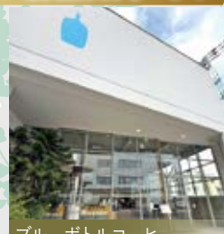
ブルーボトルコーヒー

江戸時代から歴史を紡ぐ緑豊かな清澄庭園・清澄公園をはじめ、個性豊かな深川資料館通り商店街や、ブルーボトルコーヒー(清澄白河フラッグシップカフェ)などの数多くのコーヒーショップが点在し、散歩が楽しい毎日。