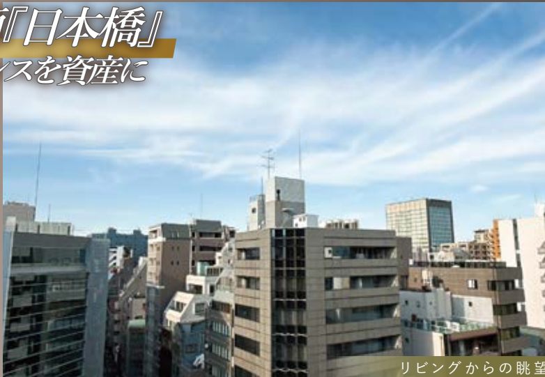
リビングからの眺望