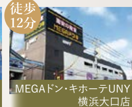
MEGAドン・キホーテUNY 横浜大口店