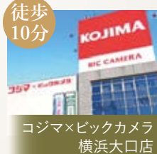
コジマ×ビックカメラ 横浜大口店