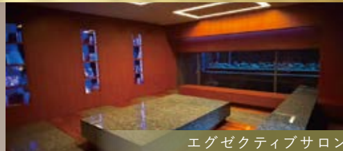
エグゼクティブサロン