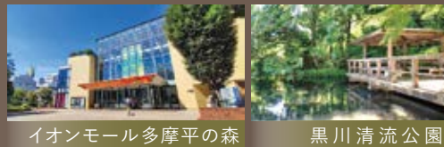
イオンモール多摩平の森