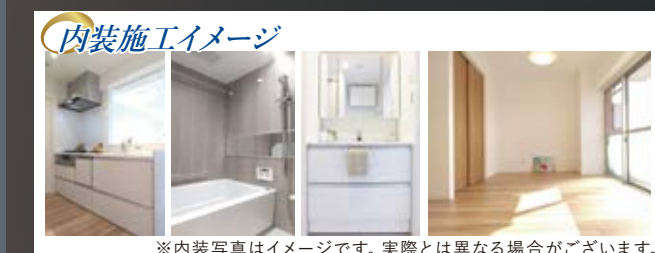
内装施工イメージ

※上記内容と現況が異なる場合は、現況優先とさせていただきます。 ※仕様及び、内装完了予定日に変更が発生する可能性があります。