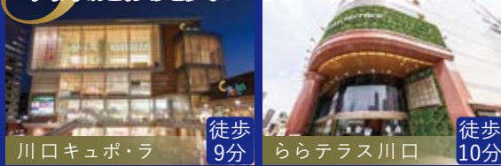
川口キュポ・ラ 徒歩9分