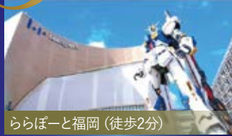
ららぽーと福岡 (徒歩2分)

令和3年の『ららぽーと福岡』 に続き、アサヒビール博多工場 跡地に再開発事業が 予定されているなど、 今注目度の高いエリアです!