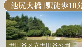
世田谷区立世田谷公園