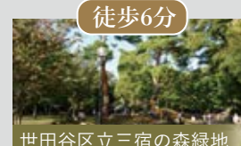
世田谷区立三宿の森緑地