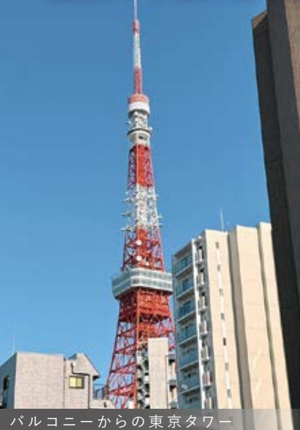
バルコニーからの東京タワー