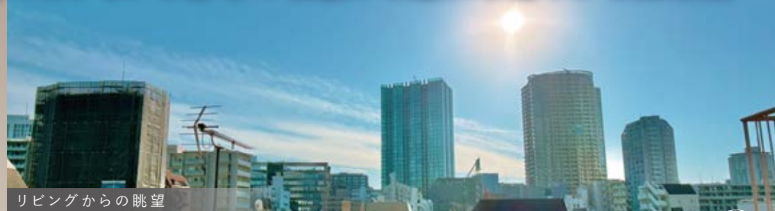
リビングからの眺望