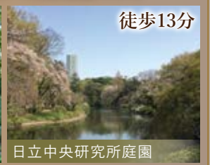
日立中央研究所庭園