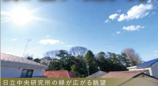
日立中央研究所の緑が広がる眺望