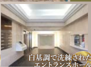
白基調で洗練されたエントランスホール