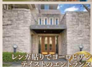
レンガ貼りでヨーロピアンテイストのエントランス