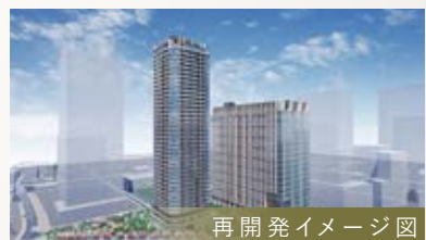
再開発イメージ図