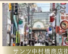
サンツ中村橋商店街