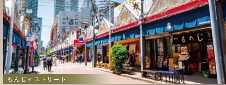
もんじゃストリート