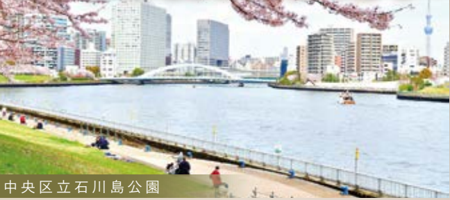
中央区立石川島公園

運河と緑道が描く、開放感あふれる『月島』の暮らし ～下町文化を足元に、都心の利便性を享受するロケーション～