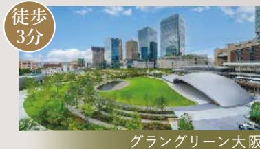
徒歩3分 グラングリーン大阪

『梅田』が生活圈! 令和9年、『グラングリーン 全体まちびらき』を控え、 ますますの利便性向上が 期待されます!