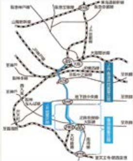
なにわ筋線路線図

なにわ筋線の整備計画も進行中。 将来的には、新大阪や関空への アクセスもさらに便利に!