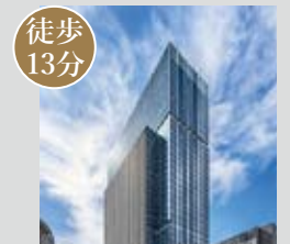
徒歩13分 ハービスPLAZA ENT