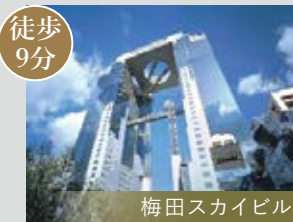
徒歩9分 梅田スカイビル

多彩な商業施設が立ち並ぶ『梅田』まで徒歩圏! おしゃれで多様な飲食店が魅力的な「福島」駅周辺。都市型の 利便性と下町のホッと温かさが暮らしを豊かに!