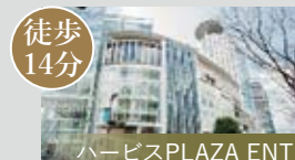
徒歩14分 ハービスPLAZA ENT